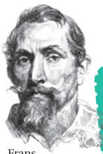
Frans Snijders DE FORTUYN