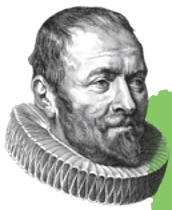
Nicolaas Rockox DEN GULDEN RINCK