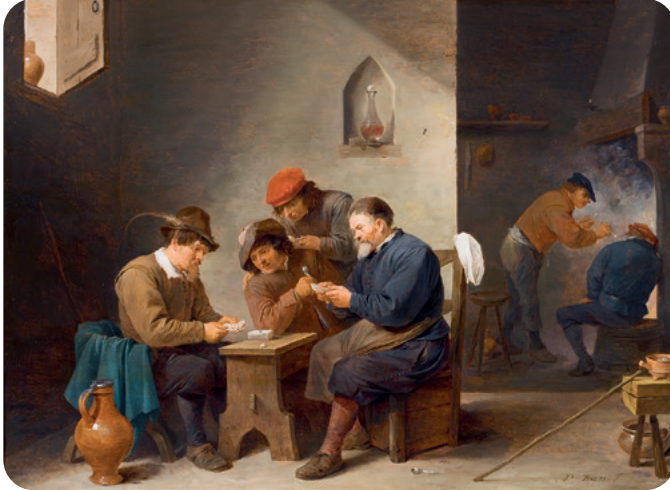
Kaartspelers in een herberg