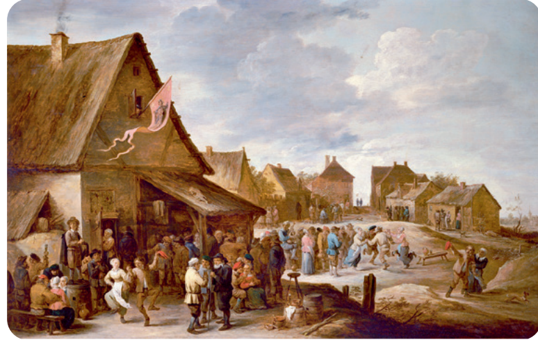
Dorpsfeest (momenteel in zaal 10)